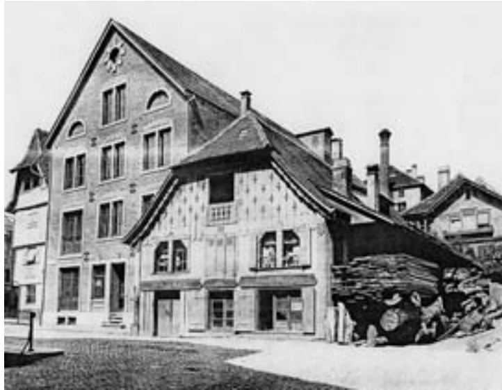
Merianische Sägemühle in Basel. Photographie, um 1900