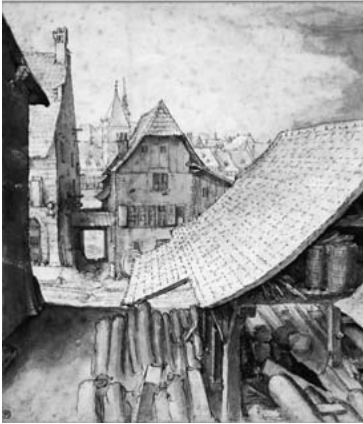
Merianische Sägemühle in Basel. Handzeichnung, 1615/16

weiter im Gäßlein eine Baliermühle, d. h. eine Waffenschmiede und Messerschleiferei (Säbergäßlein 5). Das ganze Quartier rund um die Arme des Riehenteichs bildete den wirtschaftlichen und gewerblichen Lebensnerv von Kleinbasel, zugleich ein für die Kinder der ansässigen Handwerker äußerst anregendes Tummelfeld.